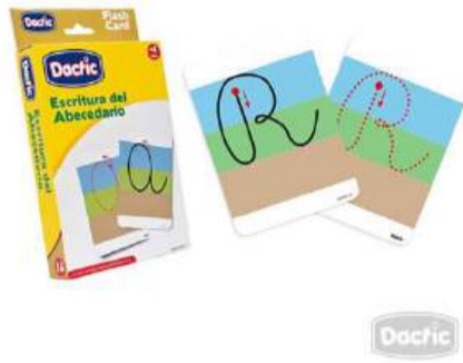
ANEXO 2. Abecedario escritorio letra manuscrita.